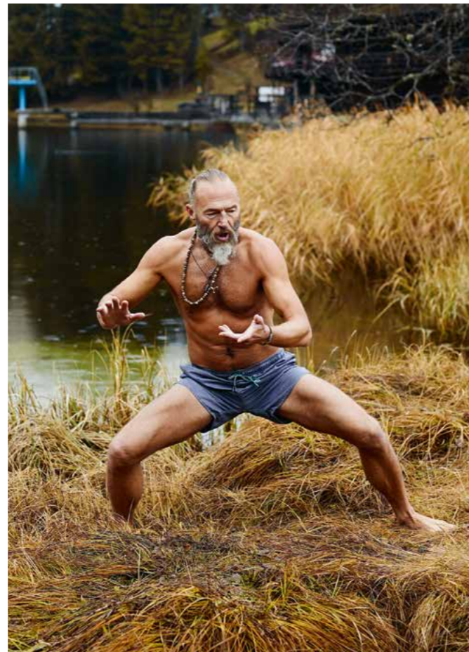
Die Vor- und Nachbereitung ist essentiell beim Eisbaden.

Raclette-Ofen, klebrige Hände, die sich an die dritte Glühweintasse auf dem Weihnachtsmarkt klammern. Wärme, merke ich, ist mehr als nur physische Hitze. Sie ist ein Erlebnis, ist Erinnerung und Hoffnung, ist Freundschaft und Vertrauen. Vielleicht ist das doch etwas esoterisch gedacht, aber sei's drum. Ich mache drei Schritte in das Wasser hinein, vier, fünf. Die Kälte ist fast betäubend. Ich gehe in die Knie, presse meine Arme an die Seite und lege meine Hände auf die Oberschenkel. Ich konzentriere mich stark auf diese kleinen Flecken der Wärme, atme, das Wasser an meinem Hals.