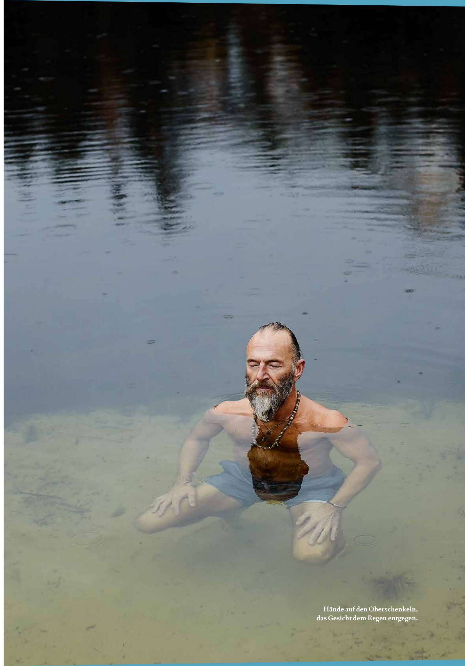
Hände auf den Oberschenkeln, das Gesicht dem Regen entgegen.