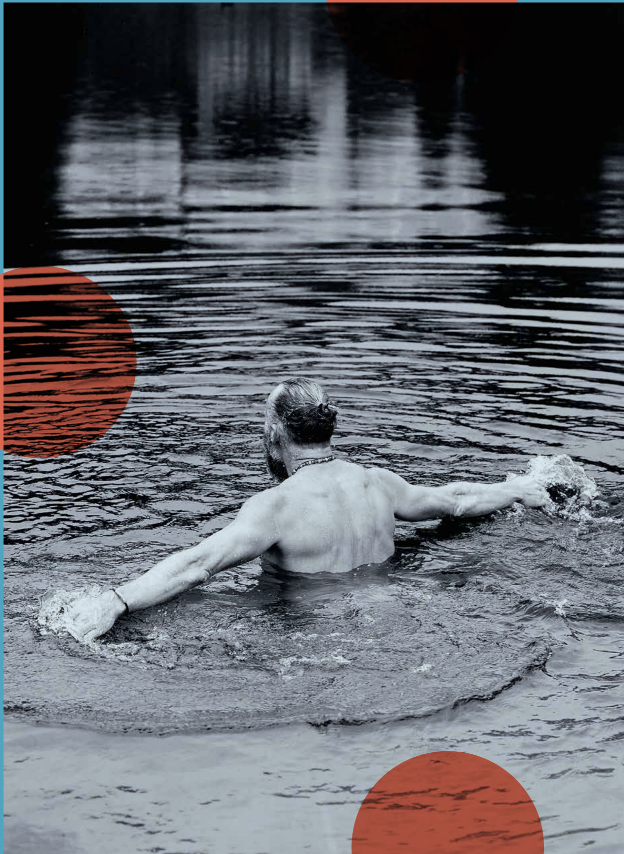
Raus aus der Komfortzone, hinein ins kalte Wasser.